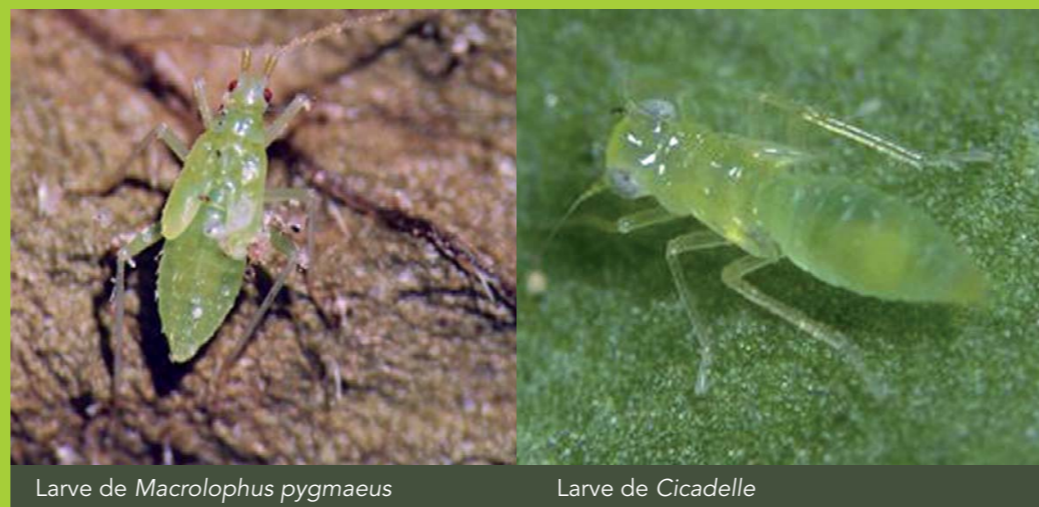
Larve de Macrolophus pygmaeus